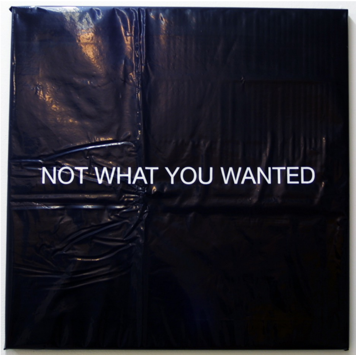
Not what you wanted 2015. Vinilo sobre plástico 50x50 cm