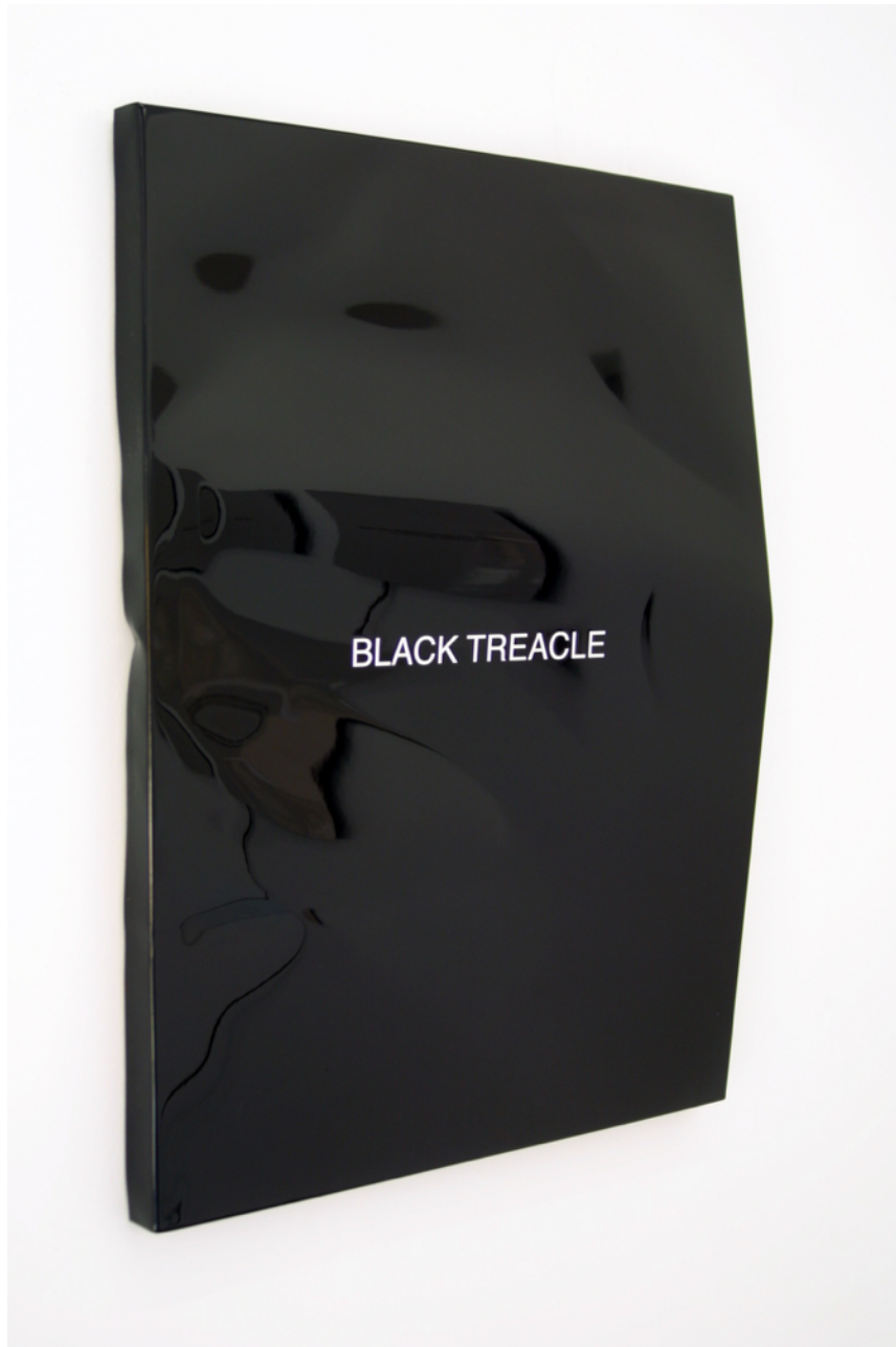
Black Treacle , 2015. Pintura sobre aluminio, 74 x 54 cm