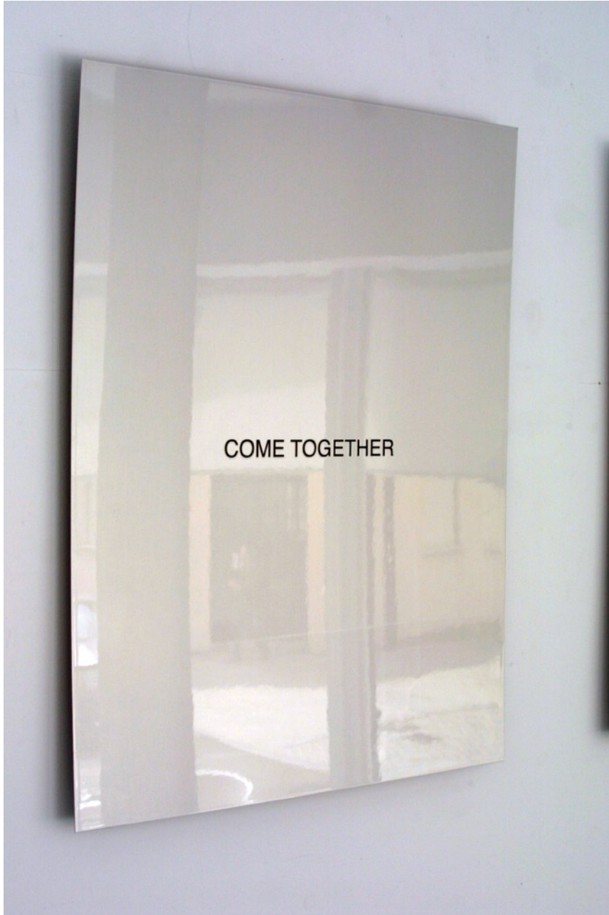
Come together , 2015. Vinilo barnizado sobre aluminio, 80 x 60 cm