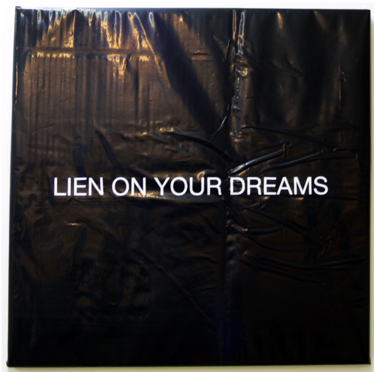
Lien on your dreams 2015. Vinilo sobre plástico 50x50 cm