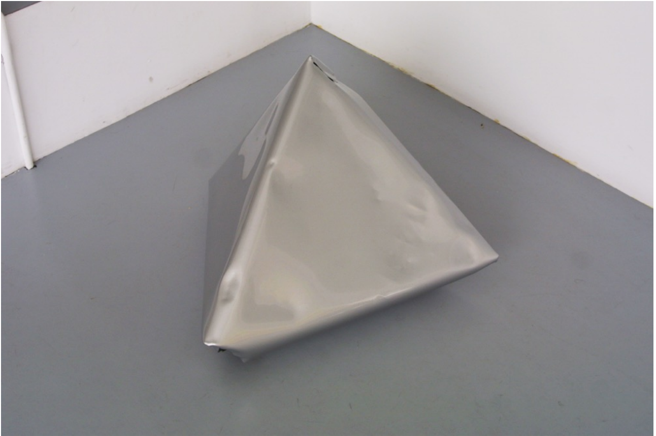
Sin título (silver 03) 2015. Pintura sobre aluminio, 60 x 50 x 40 cm aprox.