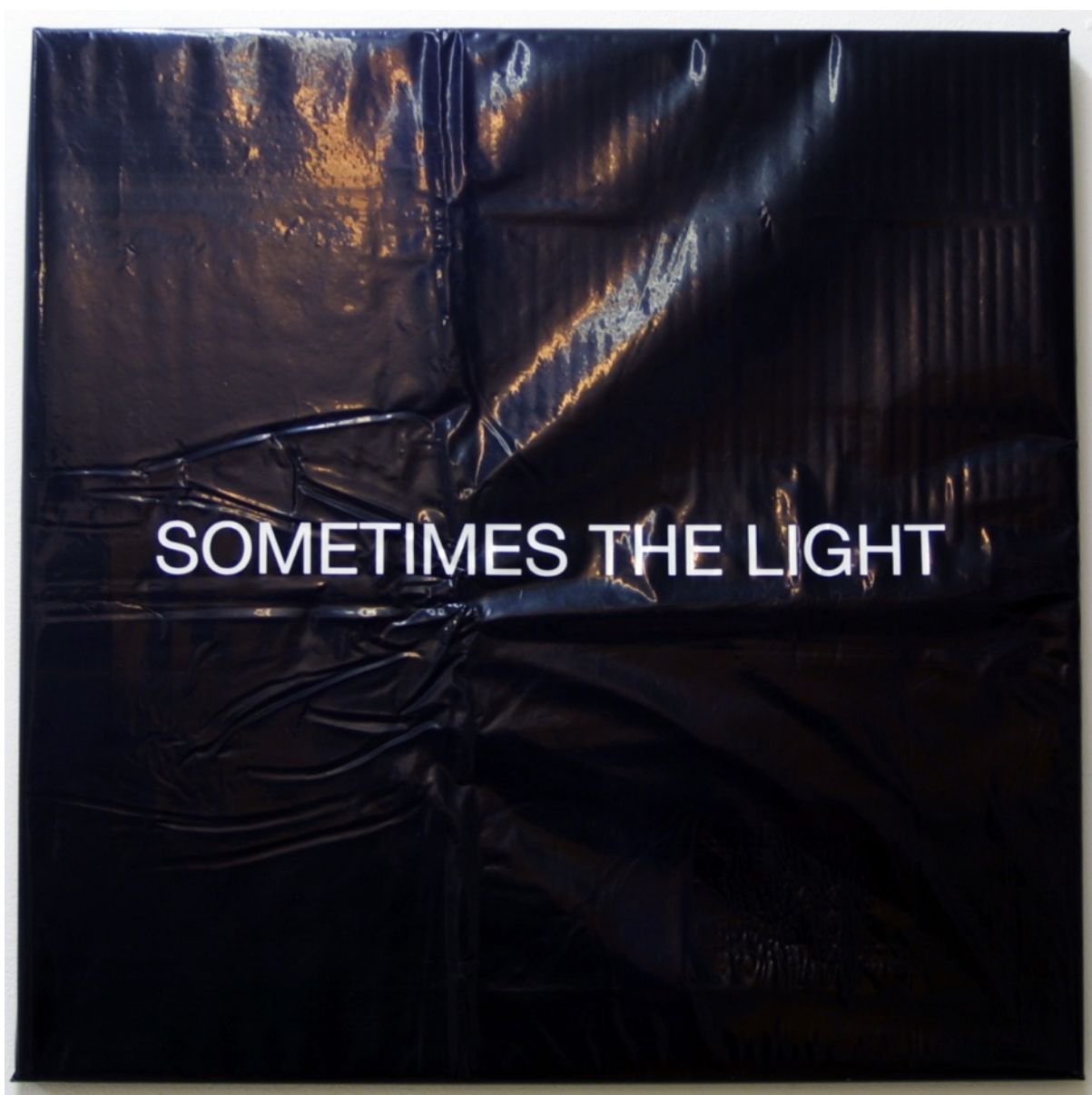
Sometimes the light 2015. Vinilo sobre plástico 50x50 cm