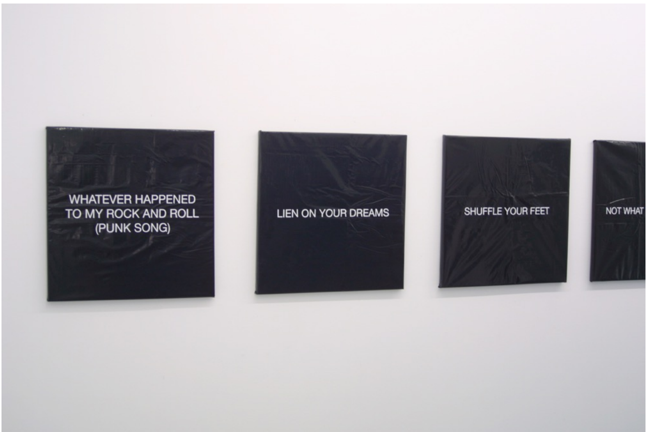
Luis San Sebastián, 10 Songs , 2015. Vista de la instalación, Galería Adora Calvo.