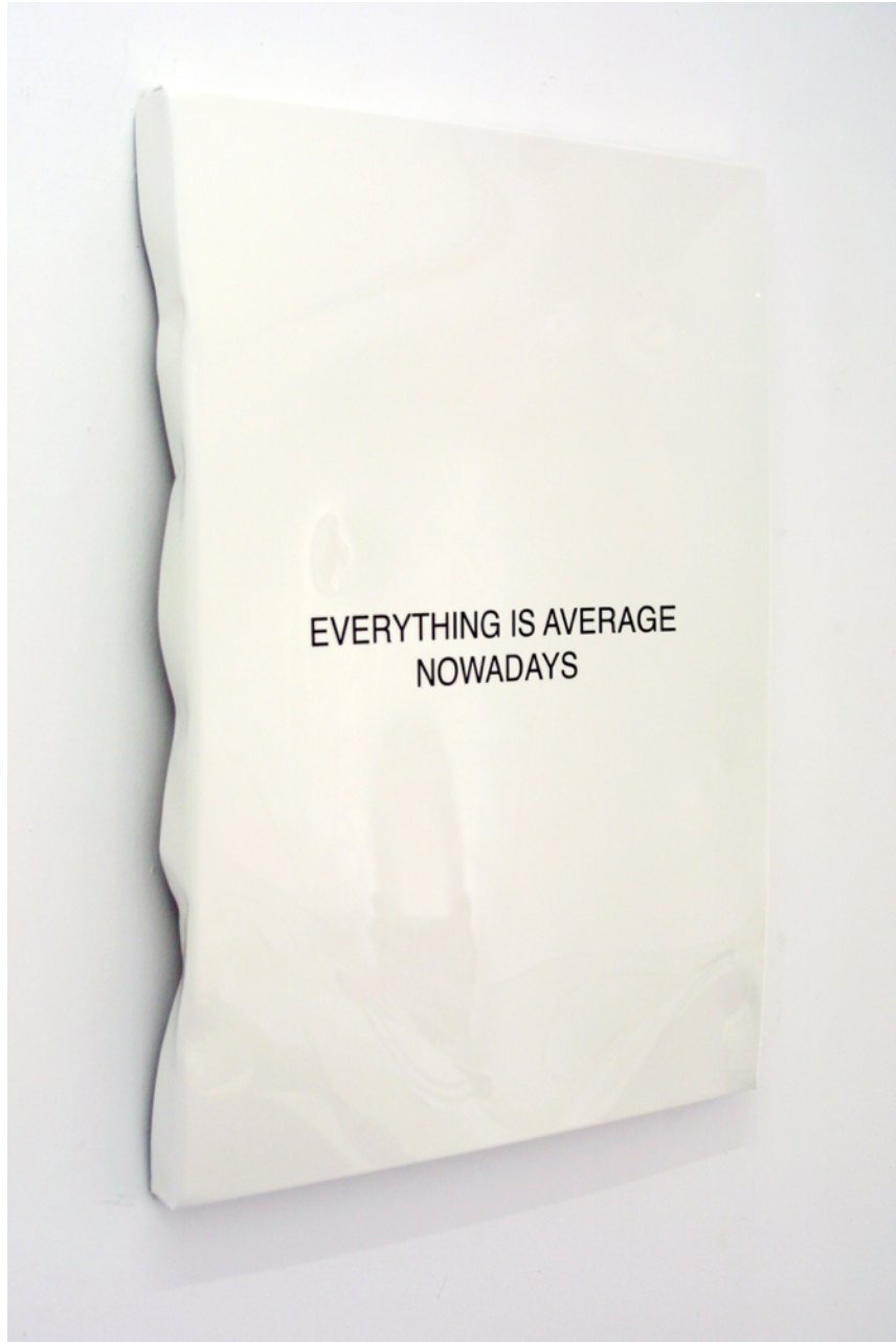
Everything is average nowadays , 2015. Pintura sobre aluminio, 74 x 54 cm