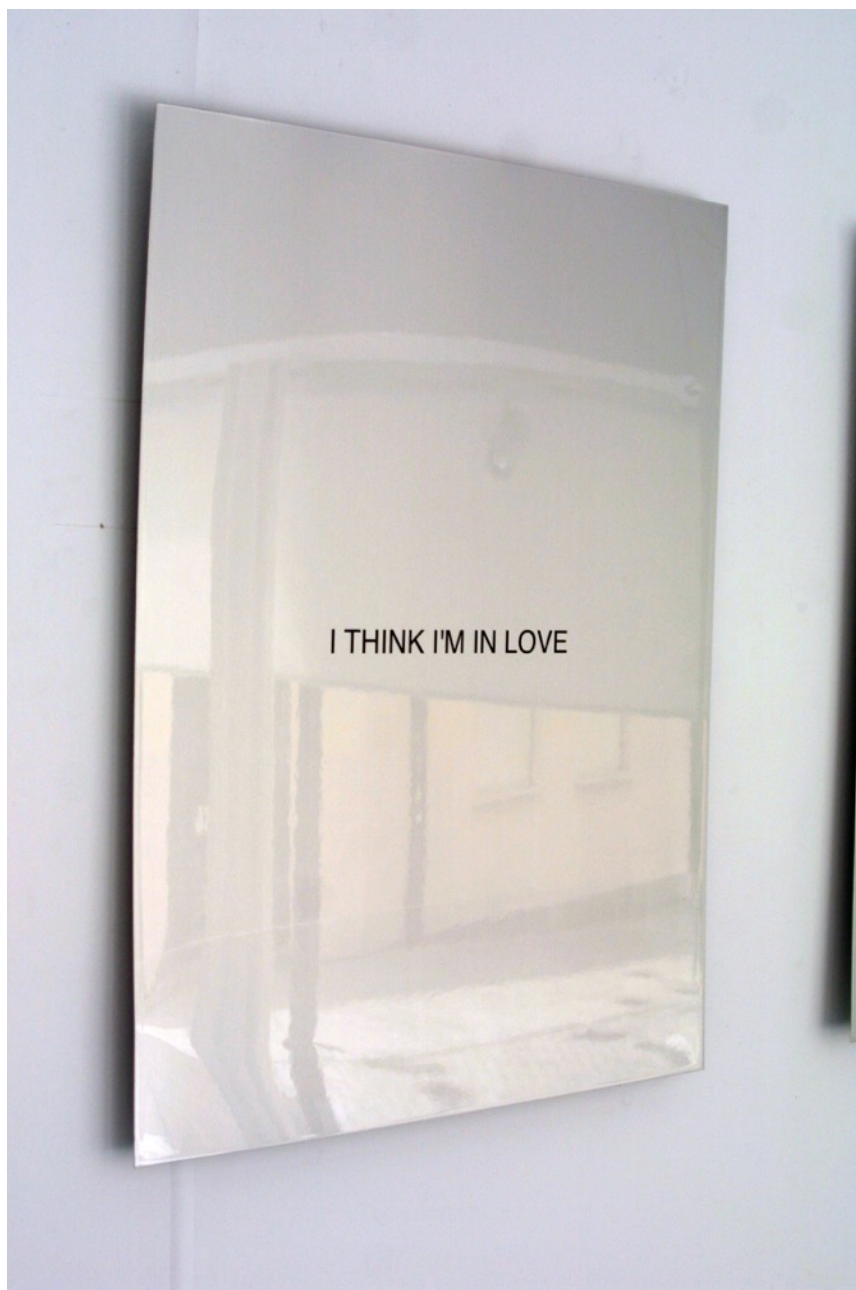
Come together , 2015. Vinilo barnizado sobre aluminio, 80 x 60 cm