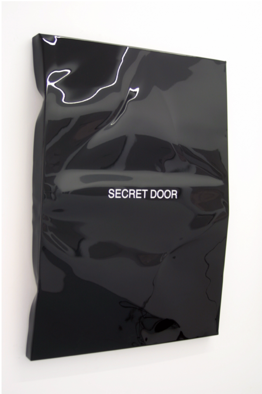
Secret door , 2015. Pintura sobre aluminio, 74 x 54 cm