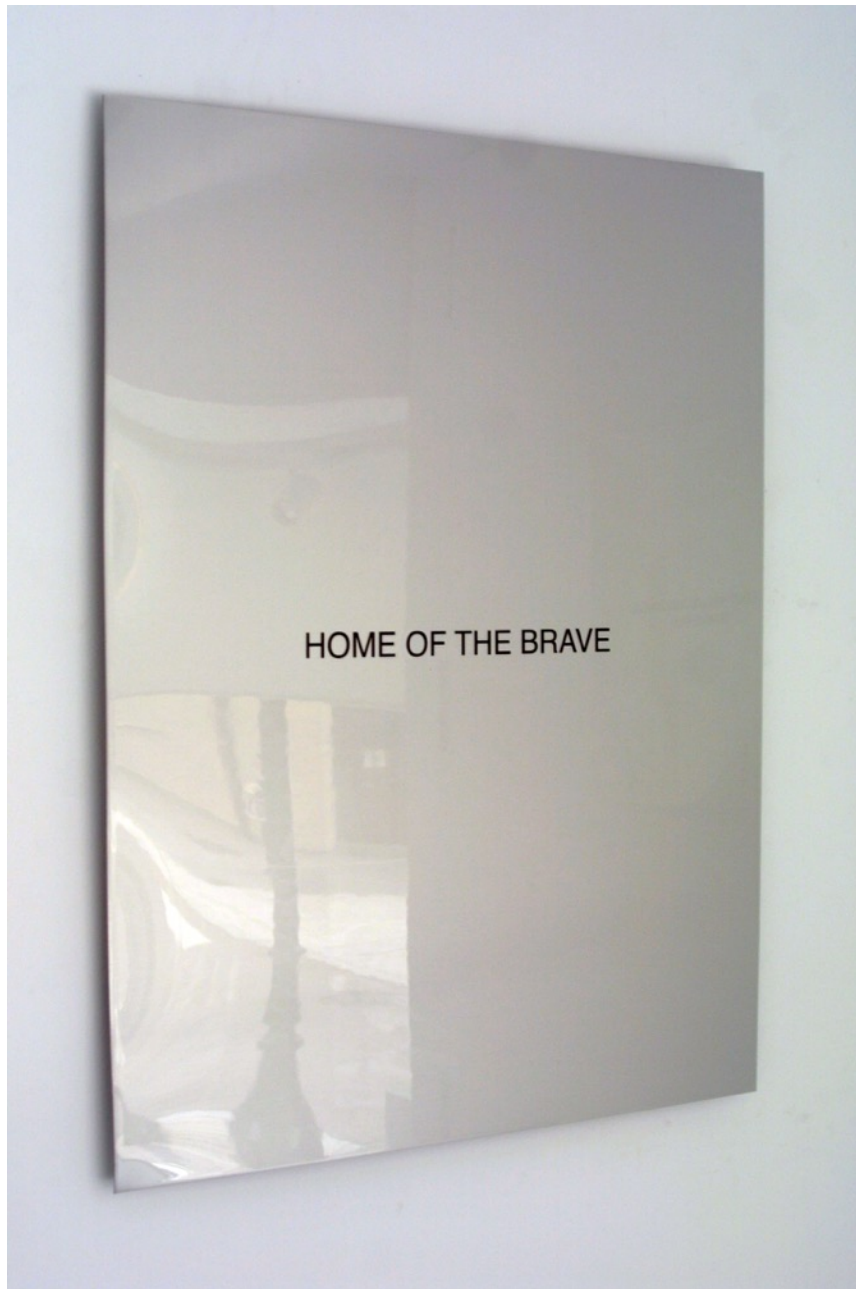
Home of the brave , 2015. Vinilo barnizado sobre aluminio, 80 x 60 cm