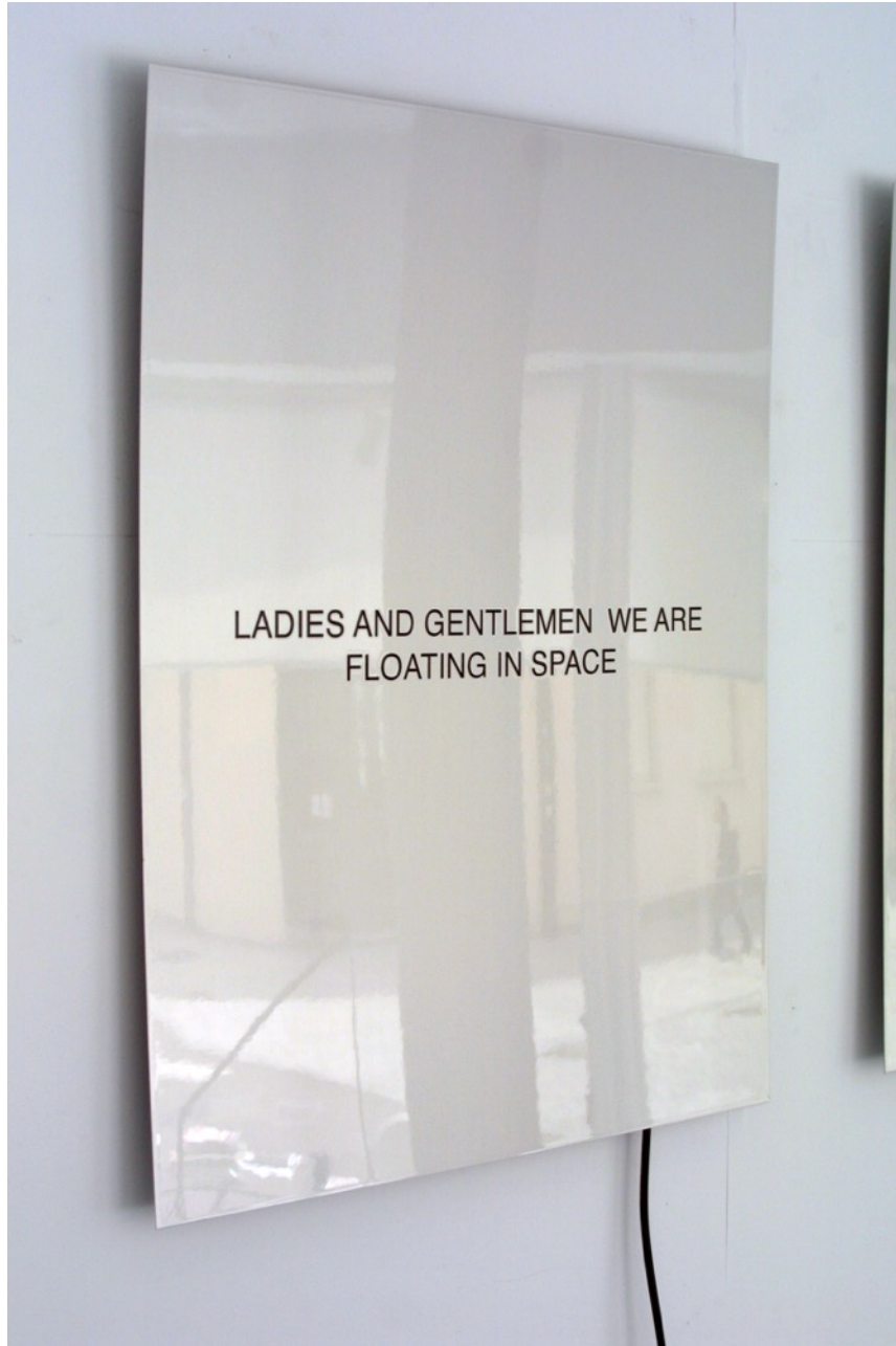
Ladies and gentlemen , 2015. Vinilo barnizado sobre aluminio, pedal de phaser y amplificador, sonido, 80 x 60 cm