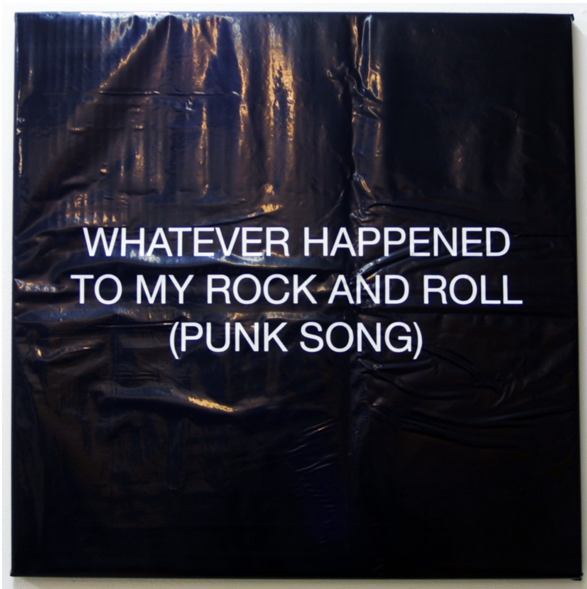
Whatever happened to my rock and roll 2015. Vinilo sobre plástico 50x50 cm