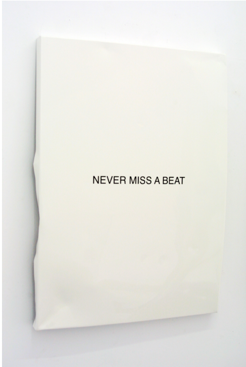
Never miss a beat , 2015. Pintura sobre aluminio, 74 x 54 cm