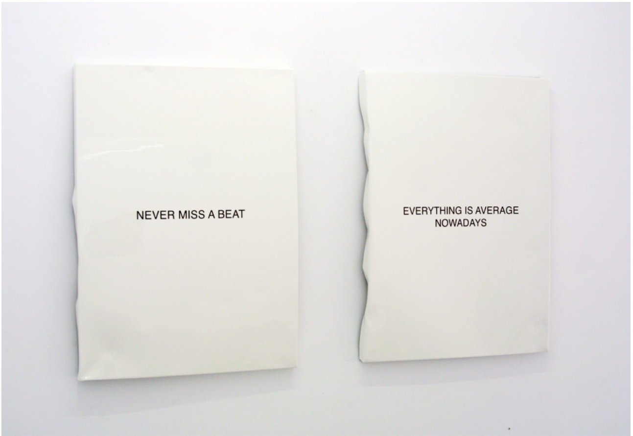
Never miss a beat , 2015. Pintura sobre aluminio, 74 x 54 cm