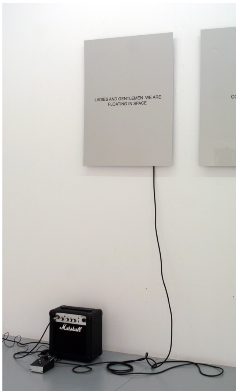
Ladies and gentlemen , 2015. Vinilo barnizado sobre aluminio, pedal de phaser y amplificador, sonido, 80 x 60 cm