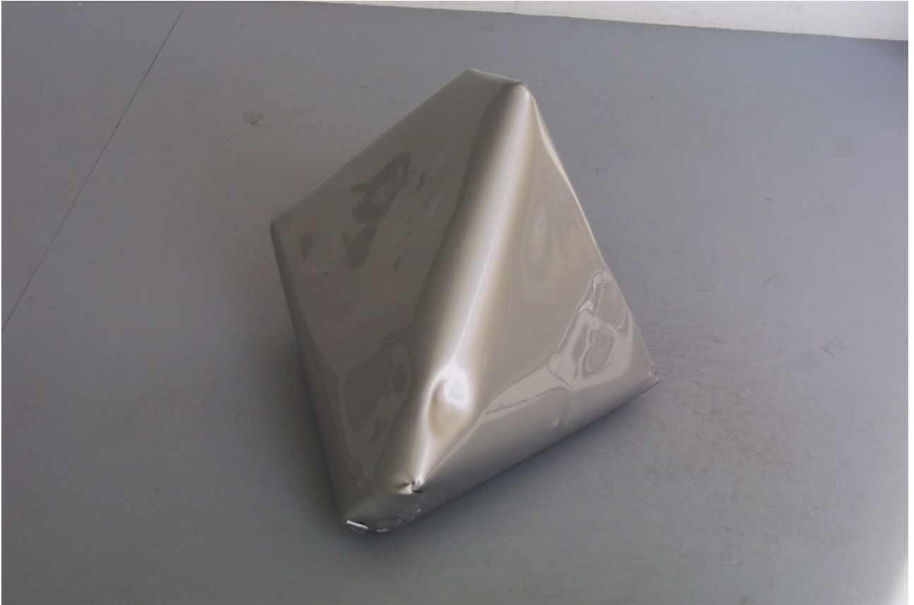
Sin título (silver 01) 2015. Pintura sobre aluminio, 60 x 50 x 40 cm aprox.