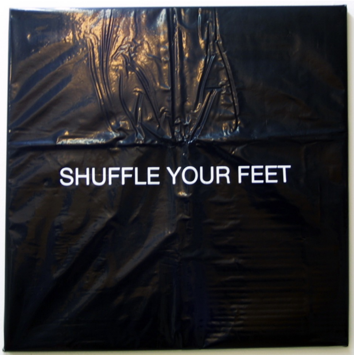
Shuffle your feet 2015. Vinilo sobre plástico 50x50 cm