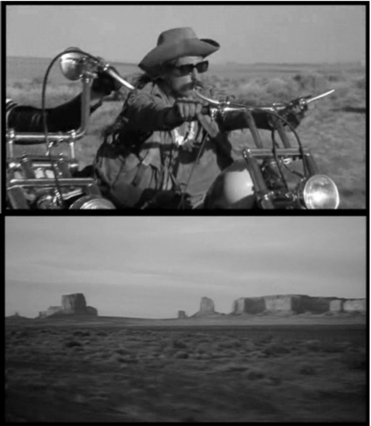
Easy rider 2015. Video, found footage, blanco y negro, sin sonido, 12 min (Easy rider 1969, Director: Dennis Hopper)