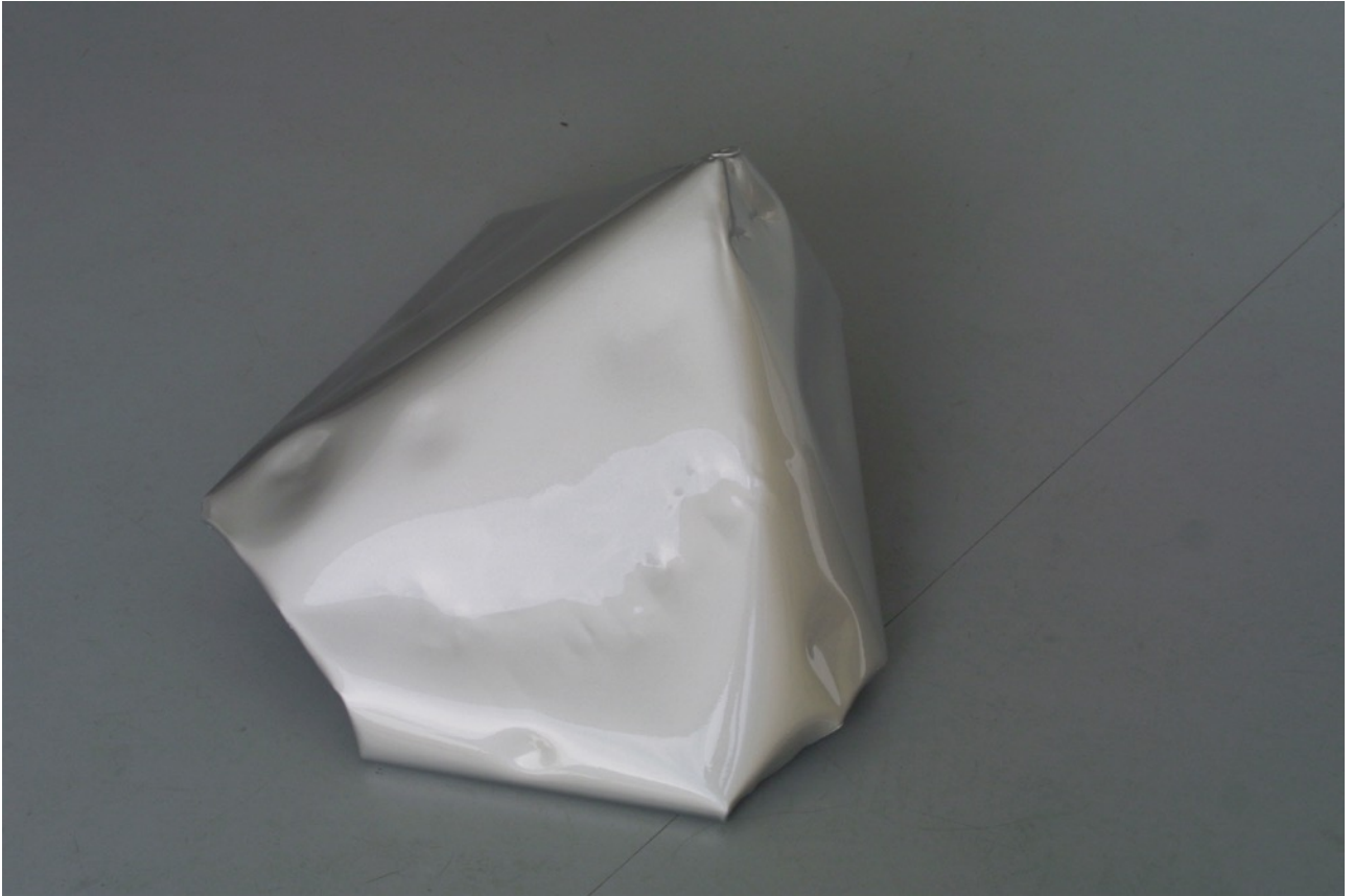
Sin título (silver 02) 2015. Pintura sobre aluminio, 60 x 50 x 40 cm aprox.