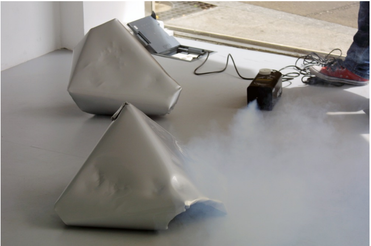
Sin título (smoke machine) 2015. Instalación. Radio de dispersión del humo unos 3 m. Fotografía de documentación.