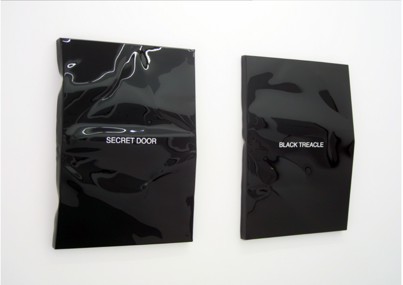
Luis San Sebastián, 10 Songs , 2015. Vista de la instalación, Galería Adora Calvo.