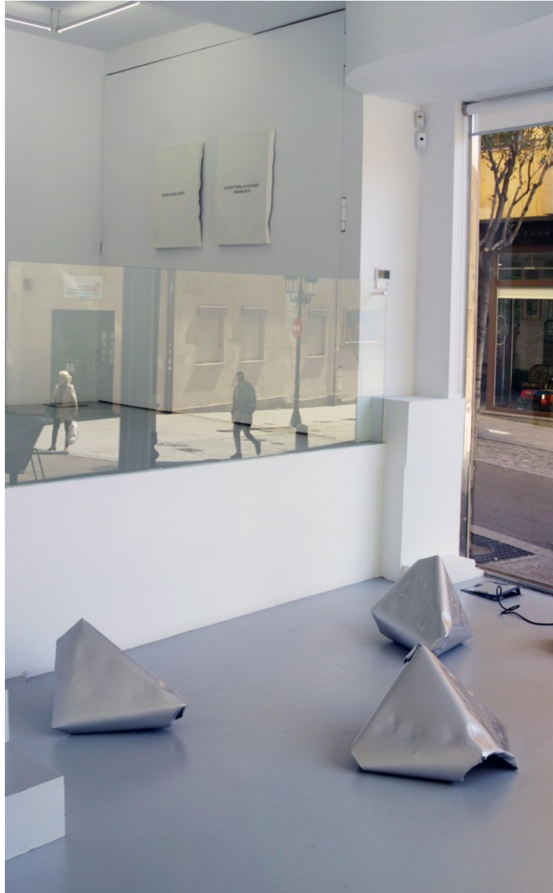
Luis San Sebastián, 10 Songs , 2015. Vista de la instalación, Galería Adora Calvo.