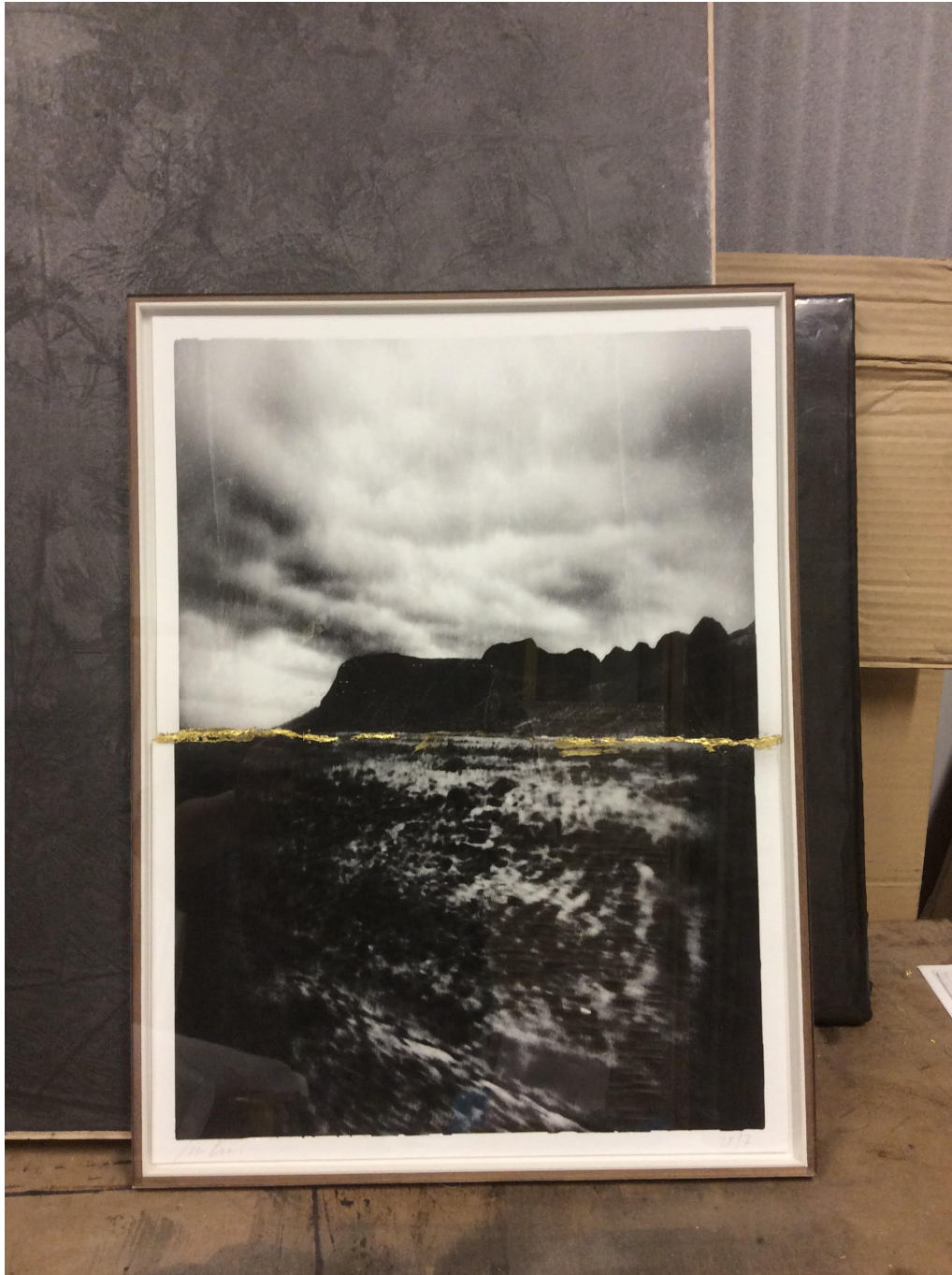
No Kintsugi 1. (2017) Ángeles San José

C/Arco, 11 - 37002 Salamanca 923212784 info@adoracalvo.com