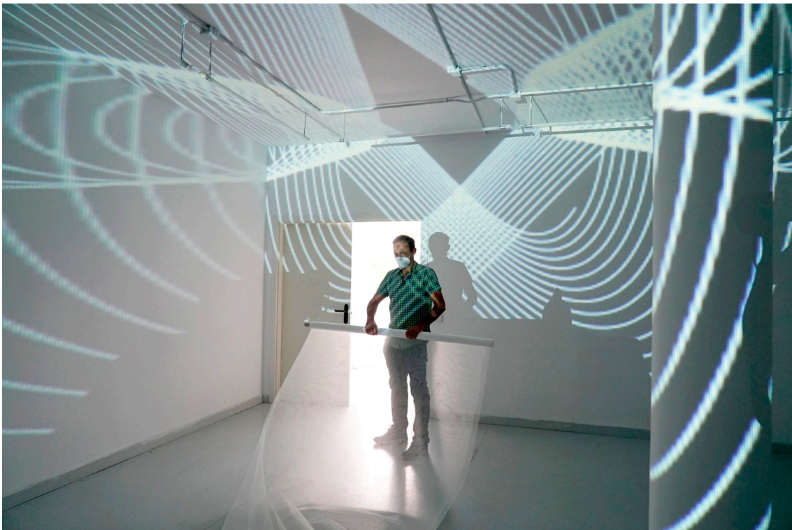
Imágenes del montaje de la exposición